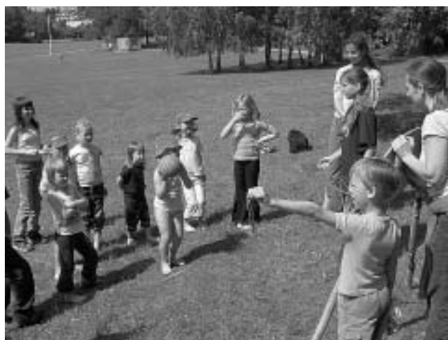
Vaikams - smagių rungtių ir prizų metas.